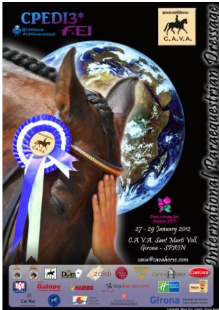
Cartel Paraecuestre (CPEDI3*)

Nota de prensa Sant Martí Vell, 2 de enero de 2012